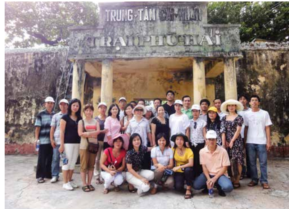
Vietcombank Đồng Nai về nguồn tại Côn Đảo

giao lưu học hỏi, gắn kết, mở rộng quan hệ với khách hàng thân thiết của Vietcombank; tạo sân chơi bổ ích, khỏe mạnh cho đoàn viên công đoàn nhằm rèn luyện sức khỏe thể chất để cống hiến và thực hiện tốt nhiệm vụ chuyên môn được giao duy trì tinh thần đoàn kết giữa các Chi nhánh ngân hàng trong cùng hệ thống, các ngân hàng bạn trên cùng