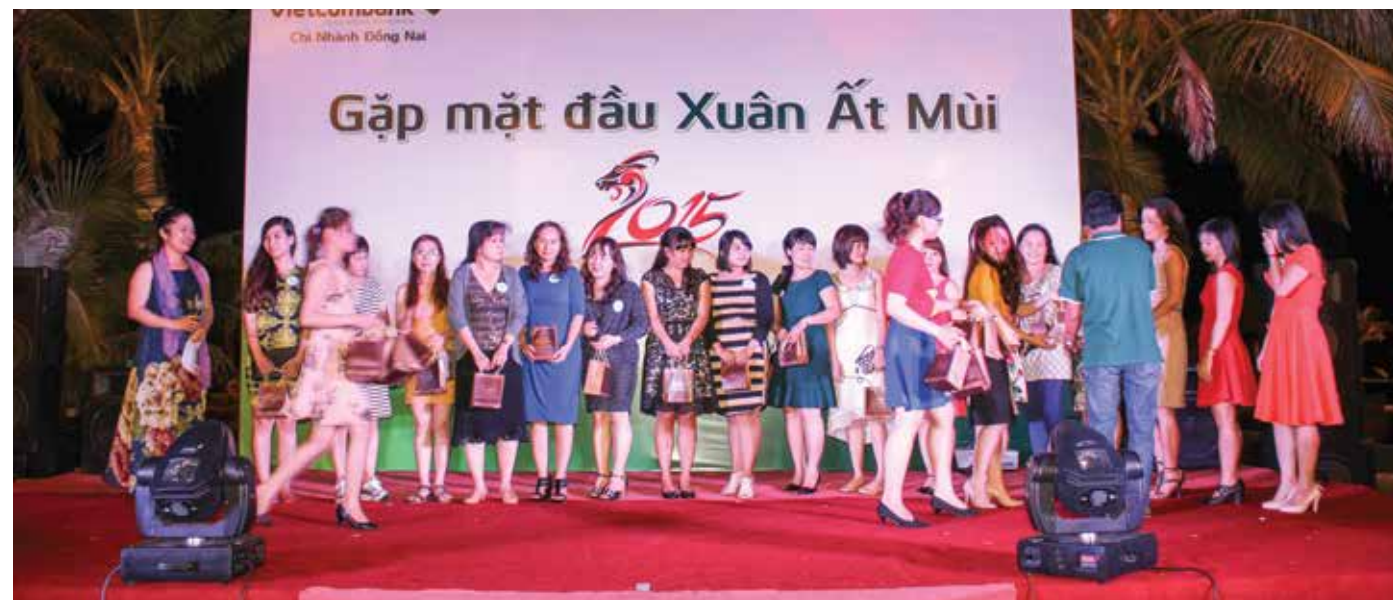
Hoạt động của Vietcombank Đồng Nai

Thành quả Vietcombank Đồng Nai đã đạt được trong hai mươi lăm năm hoạt động là rất đáng tự hào