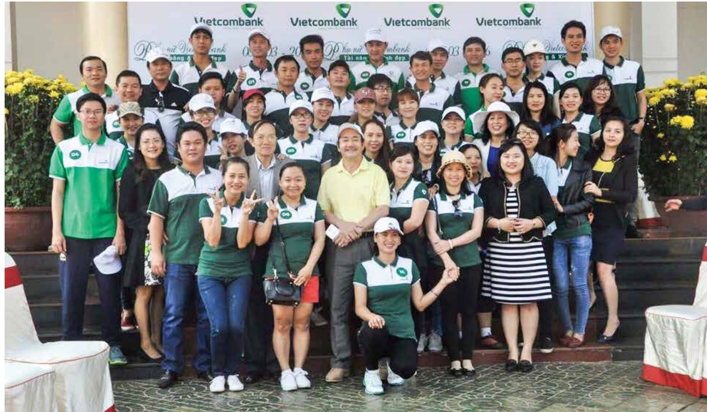
CBNV Vietcombank Gia Lai tham gia ngày hội 8 - 3