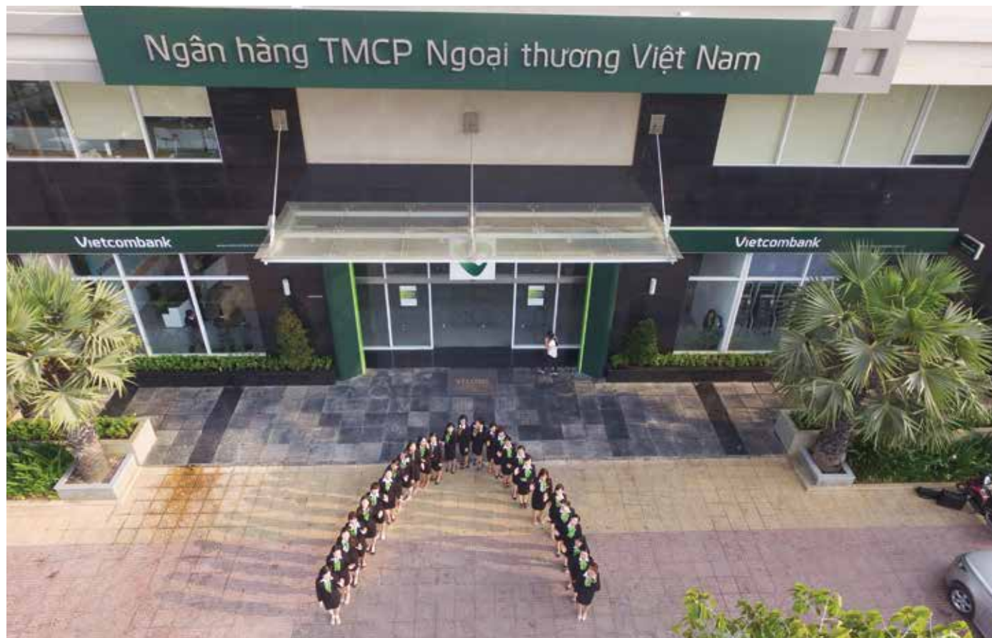
Đội ngũ Vietcombank Đồng Nai trước trụ sở

Trong giai đoạn hiện nay, toàn hệ thống Vietcombank đang nỗ lực từng ngày và tích cực đổi mới theo định hướng phát triển thành ngân hàng hiện đại ngang tầm với các ngân hàng hàng đầu trong khu vực và trên thế giới. Mục tiêu đó cần sự đồng lòng, quyết tâm của mỗi Chi nhánh và mỗi người Vietcombank. Với những thành quả trên chặng đường 25 năm qua của Vietcombank Đồng Nai, toàn hệ thống tiếp tục dành cho Vietcombank Đồng Nai sự yêu mến và tin tưởng vào những thành công to lớn hơn của Vietcombank Đồng Nai trong tương lai. Thành công của Vietcombank Đồng Nai sẽ góp phần vào niềm tin chung của khách hàng và Vietcombank, cùng Vietcombank vươn cao, vươn xa trong hành trình phía trước. □