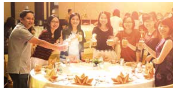
Nào cùng nâng ly chúc mừng