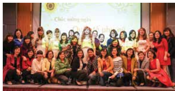
Chương trình “Cho một nửa yêu thương”

Tại chương trình, các chị em đã được chia thành các đội, tham gia phần thi trang điểm với yêu cầu là hóa trang một bạn nam thanh niên thành cô dâu xinh đẹp. Có một điều đặc biệt là không ai được chuẩn bị cũng như biết trước nội dung của phần thi mà đều phải dùng phụ kiện do Ban tổ chức cung cấp. Sau