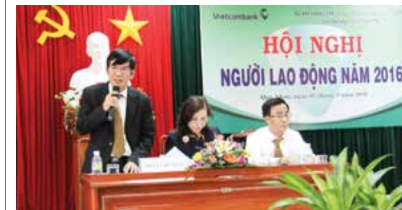
Đoàn Chủ tịch điều hành Hội nghị NLD Vietcombank Quy Nhơn năm 2016