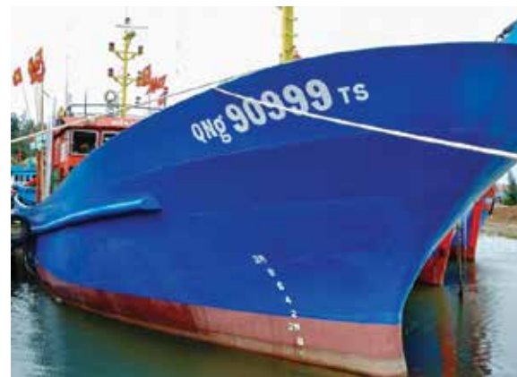
Con tàu mang tên Biển Đông 01, số hiệu QNg - 90999 được bàn giao cho ngư dân Võ Văn Hân

rada, máy định vị kết hợp hải đồ điện tử tích hợp thiết bị nhận dạng và các trang thiết bị hiện đại công nghệ Nhật Bản khác với tổng mức