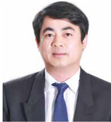
TS. NghiêM Xuân Thành - Bí thư Đảng ủy, Chủ tịch HĐQT Vietcombank