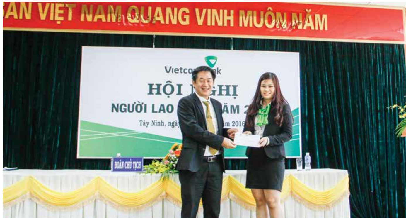
Giám đốc Vietcombank Tây Ninh (bên trái) trao giải Nhất cho tập thể PGD Gò Dầu với thành tích hoàn thành xuất sắc các chỉ tiêu kinh doanh năm 2015