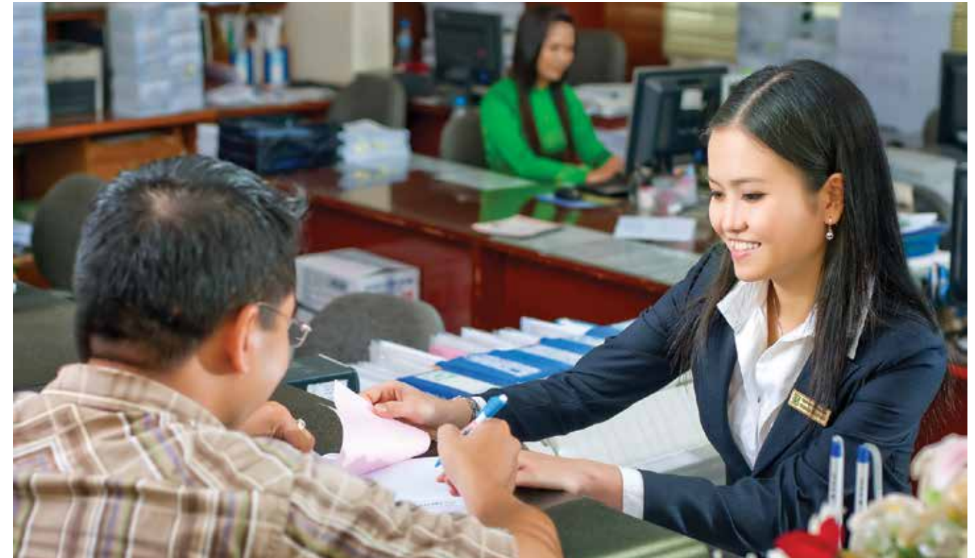
Khách hàng đến giao dịch tại Vietcombank Đồng Nai

Ngoài việc luôn nỗ lực để duy trì mức tăng trưởng trong sản xuất và kinh doanh, Thaco còn luôn tuân theo triết lý kinh doanh đã đề ra là "Có tâm với xã hội, có tâm với đất nước". Thaco cũng đặc biệt quan tâm đến việc xây dựng môi trường văn hóa lành mạnh và định hình được bản sắc văn hóa riêng của Thaco. Cơ sở của việc xây dựng văn hóa này dựa trên triết lý kinh doanh và nguyên tắc "8 chữ T": "Tận Tâm - Trung Thực - Trí Tuệ - Tự Tin - Tôn Trọng - Trung Tín - Tận Tình - Thuận Tiện". Đây chính là giá trị cốt lõi của văn hóa Thaco, là tài sản vô hình nhằm xây dựng một môi trường văn hóa Thaco để tạo ra