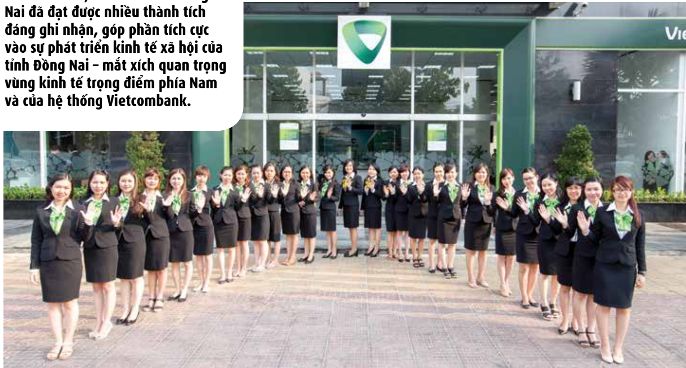
Các nữ CBNV Vietcombank Đồng Nai

Bên cạnh nỗ lực hoàn thành tốt nhiệm vụ kinh doanh, Vietcombank Đồng Nai còn thể hiện là một tập thể có trách nhiệm với xã hội, cộng đồng với việc tích cực tham gia các