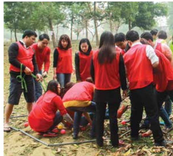
Các đội tham gia trò chơi nhật bóng

Với các hoạt động tập thể vui nhộn, chương trình đã tạo không khí vui tươi sôi nổi cho cán bộ nhân viên sau những giờ làm việc căng thẳng đồng thời chương trình cũng là cơ hội để các anh chị em, đặc biệt các anh chị em tại phòng giao dịch ở xa Trụ sở chi nhánh được giao lưu, chia sẻ tình cảm, kinh nghiệm trong cuộc sống và công việc. Từ đó tạo động lực để các cán bộ cùng nhau đoàn kết, hỗ trợ nhau để hoàn thành nhiệm vụ được giao. □