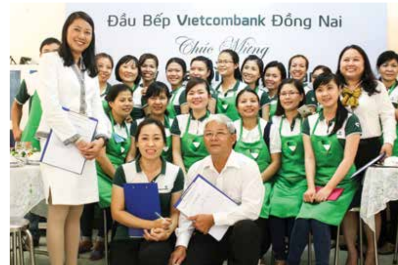
Hội thi Vua đầu bếp của Công đoàn Vietcombank Đồng Nai