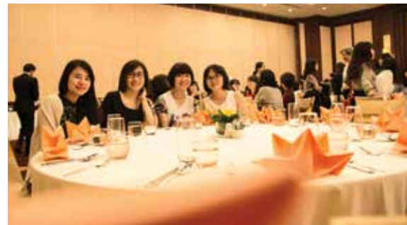
Nữ CBNV Vietcombank Đà Nẵng