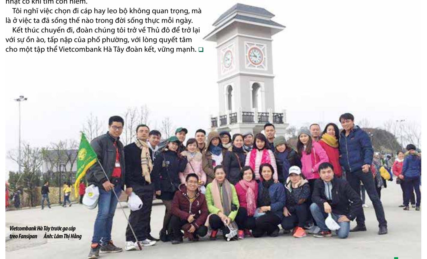
Vietcombank Hà Tây trước ga cáp treo Fansipan

Kết thúc chuyến đi, đoàn chúng tôi trở về Thủ đô để trở lại với sự ồn ào, tấp nập của phố phường, với lòng quyết tâm cho một tập thể Vietcombank Hà Tây đoàn kết, vững mạnh. □