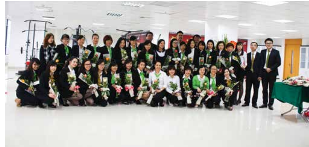
CBNV Vietcombank Hà Tây chào mừng Quốc tế phụ nữ 8/3 và khai trương Phòng tập thể dục