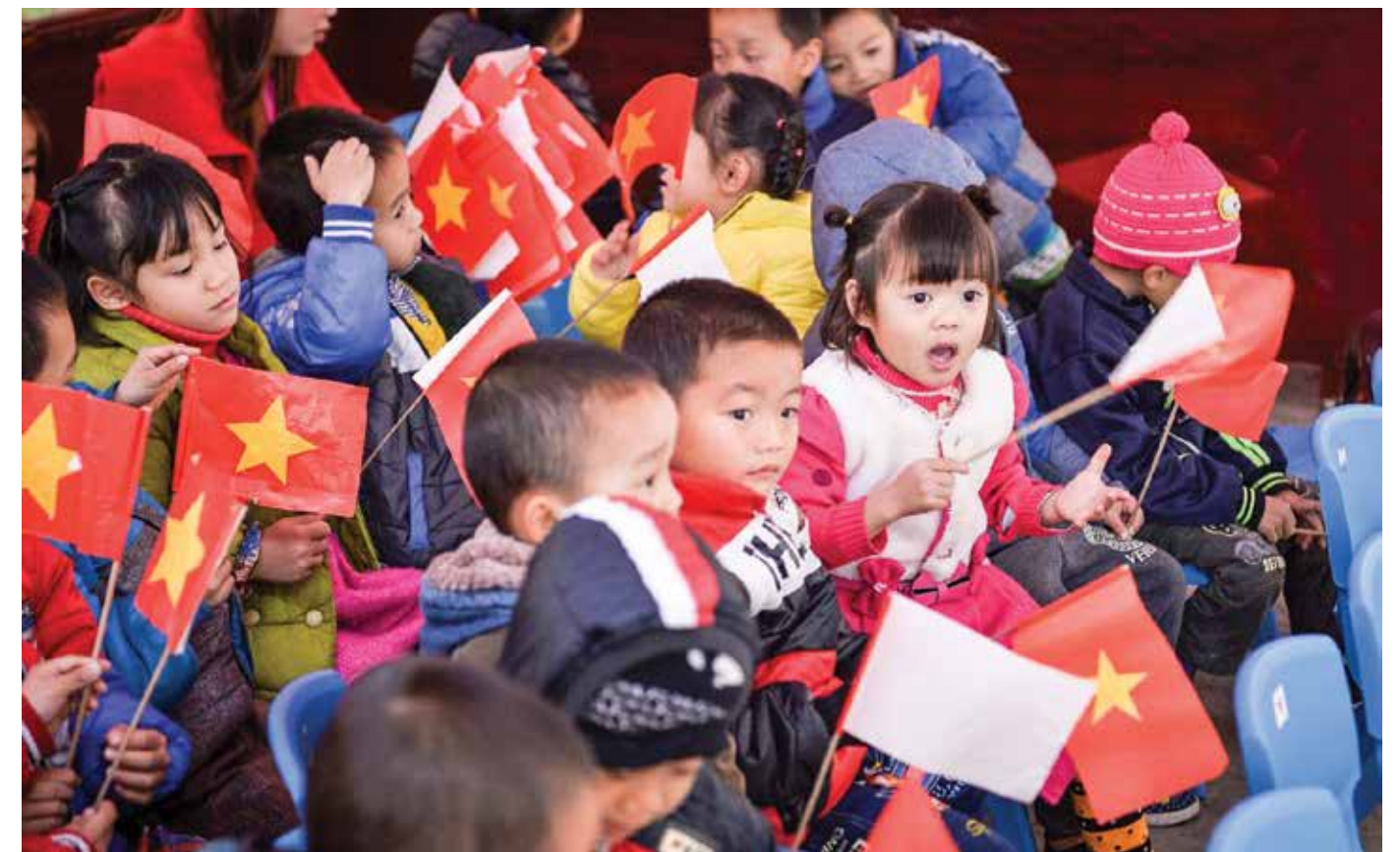
Niềm vui của các em học sinh trong ngày khánh thành ngôi trường mới

Trong khuôn khổ buổi lễ, các đại biểu đã long trọng cắt băng khánh thành và đi tham quan các phòng học của trường và chia niềm vui chung của thầy, trò và phụ huynh học sinh cũng như bà con thôn, bản đang sống xung quanh đến dự lễ khánh thành. □