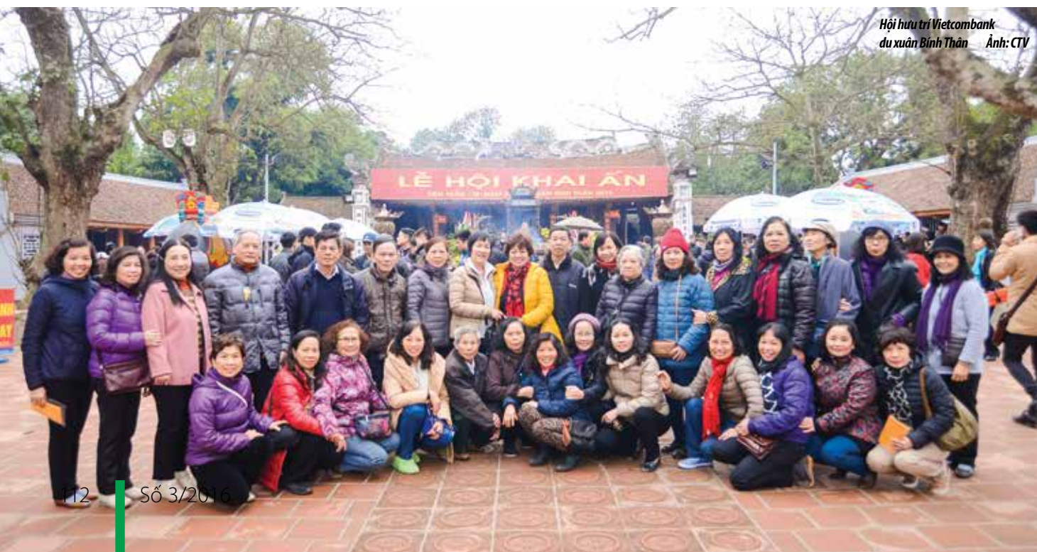
Hội hưu trí Vietcombank du xuân Bình Thuận