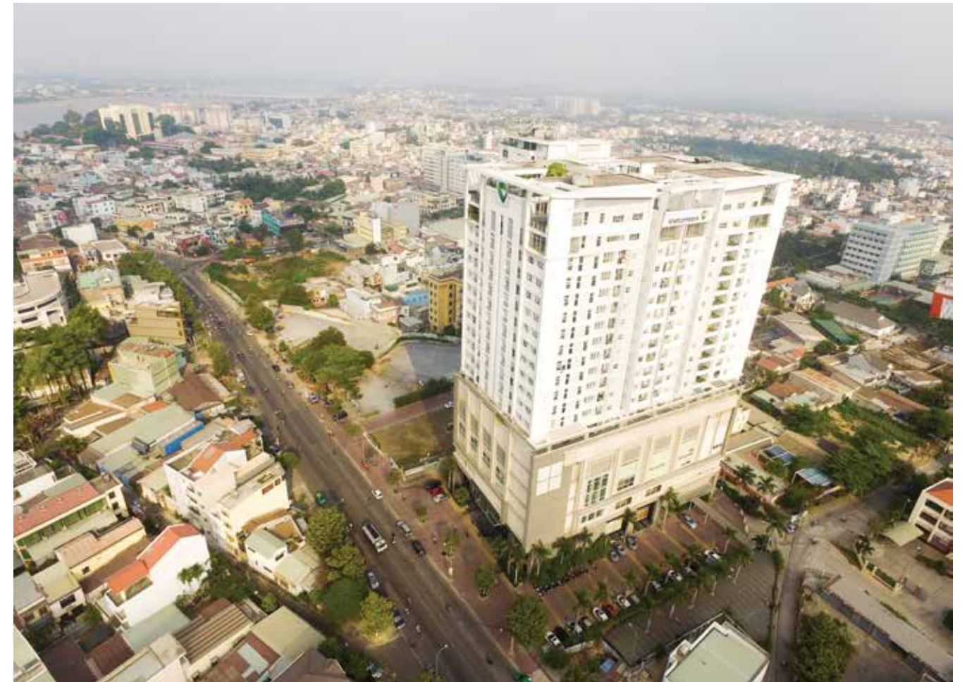
Tòa nhà trụ sở Vietcombank Đồng Nai

Bước vào tuổi 25, Vietcombank Đồng Nai đã đủ chín chắn, đã tích lũy cho mình nhiều bài học kinh nghiệm quý báu đồng thời cũng đạt đến giai đoạn vững vàng, sung sức nhất. Với định hướng đúng đắn của Ban lãnh đạo Vietcombank, Ban giám đốc chi nhánh cùng với sức mạnh đoàn kết và quyết tâm của tập thể chi nhánh, Vietcombank Đồng Nai nhất định sẽ tiếp tục chứng tỏ tầm vóc và vị thế là một trong những chi nhánh đứng đầu hệ thống và trên địa bàn, góp phần hoàn thành mục tiêu trở thành ngân hàng số 1 của hệ thống Vietcombank. □