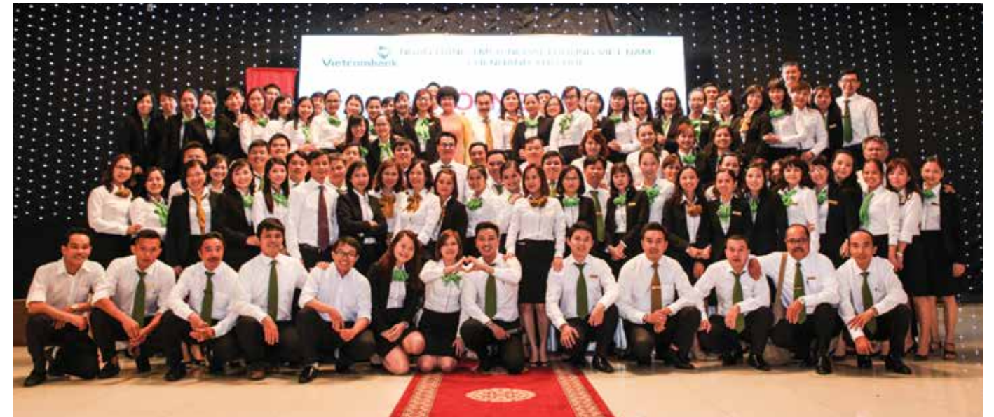
Tập thể NLD Vietcombank Thủ Đức