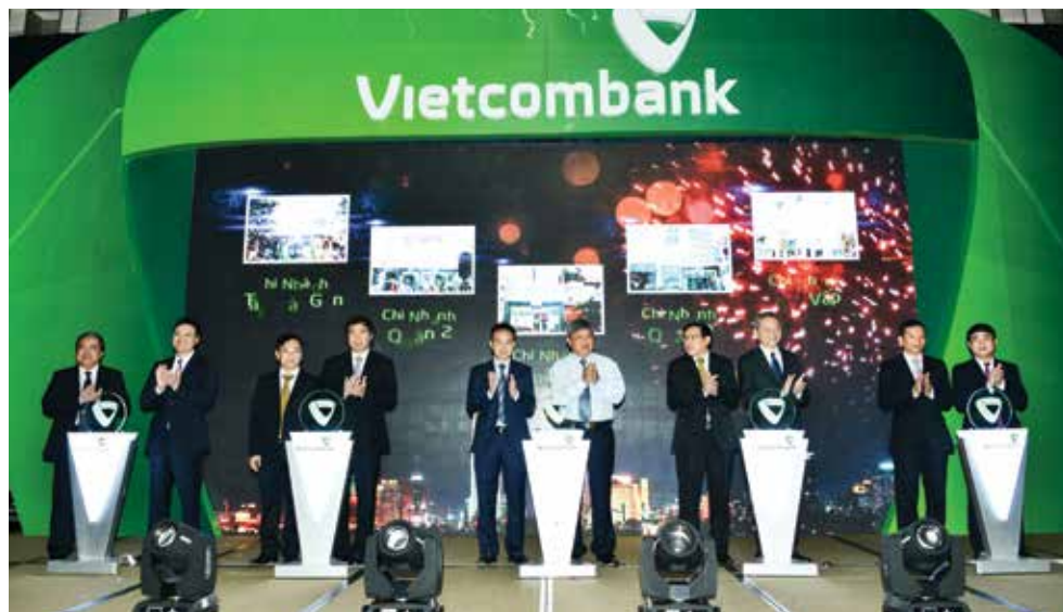
Lãnh đạo NHNN Việt Nam, Đảng ủy Khối DNTW, UBND TP.HCM và Vietcombank thực hiện nghi thức khai trương 5 chi nhánh mới

“ 5 chi nhánh mới sẽ đoàn kết đồng lòng cùng nỗ lực để phát triển nhanh chóng, hiệu quả, bền vững, góp phần đưa thương hiệu Vietcombank sớm đạt được mục tiêu trở thành ngân hàng số 1 Việt Nam