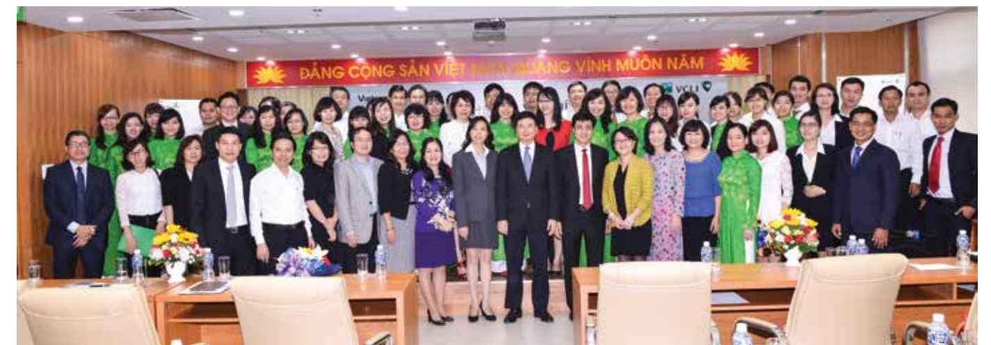
Các đại biểu tham dự sự kiện chụp hình lưu niệm tại TP Hồ Chí Minh