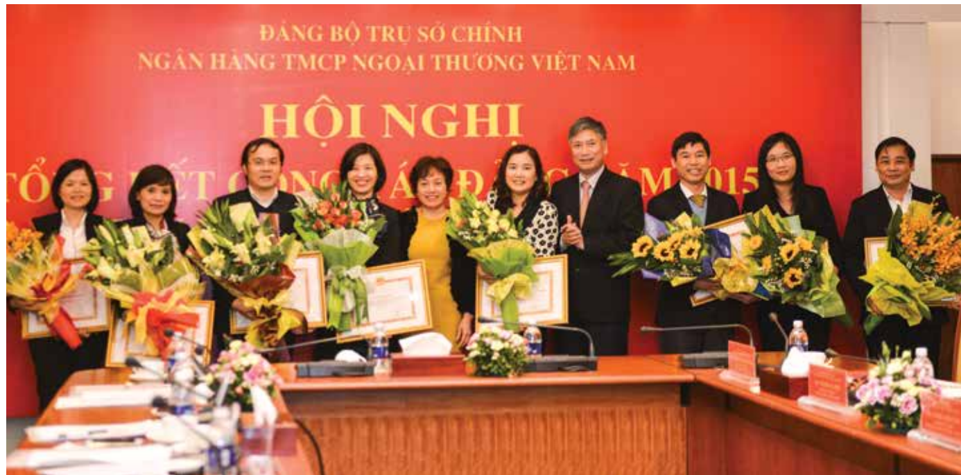
Đại diện cho 8 Chi bộ trực thuộc Đảng bộ TSC Vietcombank nhận Giấy khen

2016. Báo cáo nêu rõ: Dưới sự chỉ đạo của Đảng ủy - Ban lãnh đạo Vietcombank, Đảng ủy TSC đã tập trung chỉ đạo các Chi bộ trực thuộc, lãnh đạo các Phòng/Ban/Trung tâm thực hiện tốt các Chỉ thị, Nghị quyết của Đảng, Chính phủ; định hướng và các giải pháp điều hành chính