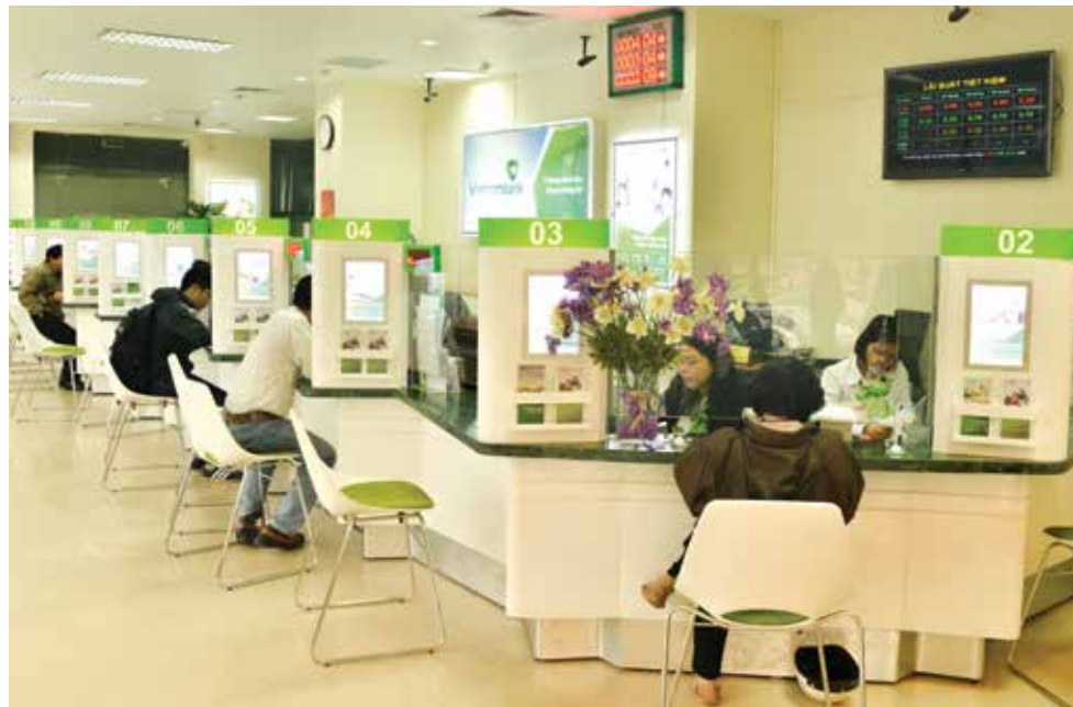
Giao dịch tại Vietcombank