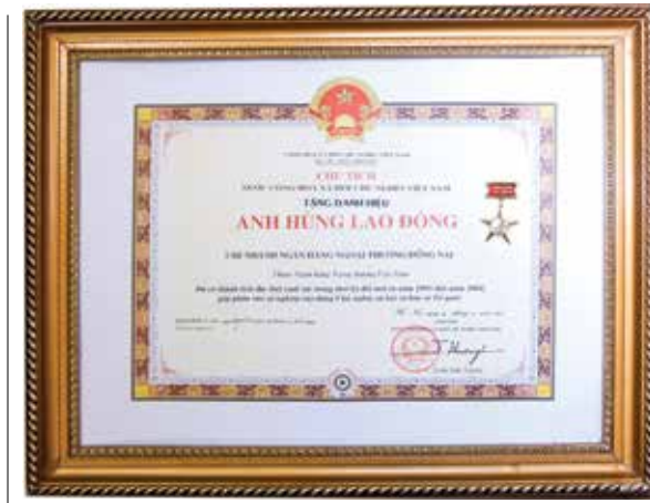
Danh hiệu Anh hùng Lao động của Chủ tịch nước tặng Vietcombank Đồng Nai

Thứ hai, về huy động vốn, với các chính sách khách hàng hợp lý, phát triển thêm nhiều loại hình dịch vụ mới, chú trọng đổi mới phong cách phục vụ, nâng cao chất lượng phục vụ, mở rộng mạng lưới phòng giao