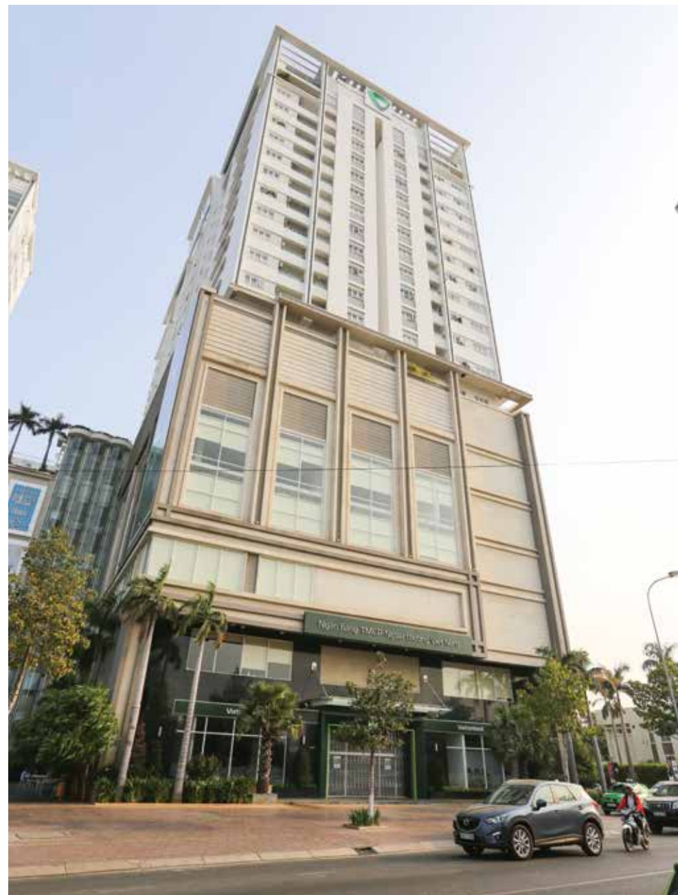
Trụ sở mới của Vietcombank Đồng Nai

25 năm – một chặng đường đã qua, những thành quả mà tập thể lãnh đạo và cán bộ, người lao động của Vietcombank Đồng Nai đã đạt được là to lớn. Trong chặng đường phát triển tới đây, dù bối cảnh kinh doanh còn nhiều khó khăn, cạnh tranh ngày một gay gắt, nhưng với truyền thống và thành quả đạt được, Đảng ủy, Ban lãnh đạo Vietcombank luôn đặt niềm tin và kỳ vọng từ tập thể Ban giám đốc tới từng cán bộ, người lao động của Vietcombank Đồng Nai tiếp tục nỗ lực nhiệt huyết, chung sức, chung lòng, cống hiến trí và lực xây dựng Vietcombank Đồng Nai ngày càng lớn mạnh... để cùng với các thành viên trong toàn hệ thống xây dựng ngôi nhà chung Vietcombank phát triển vững mạnh, bền vững và hiệu quả, sớm đưa Vietcombank trở thành ngân hàng số 1 của Việt Nam trong thời gian tới. □