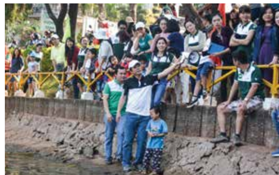
Hội thi mang tính đoàn kết tập thể, đã nhận được sự cổ vũ nhiệt tình của toàn thể cán bộ Vietcombank Gia Lai