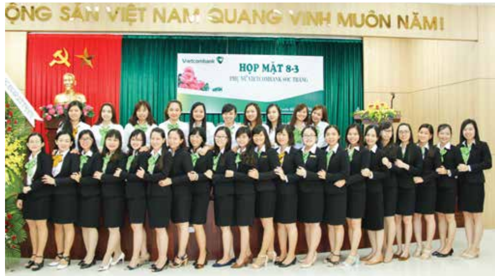
Tập thể cán bộ nữ Vietcombank Sóc Trăng tại buổi Tọa đàm

» LUONG CỬU LONG – Vietcombank Sóc Trăng