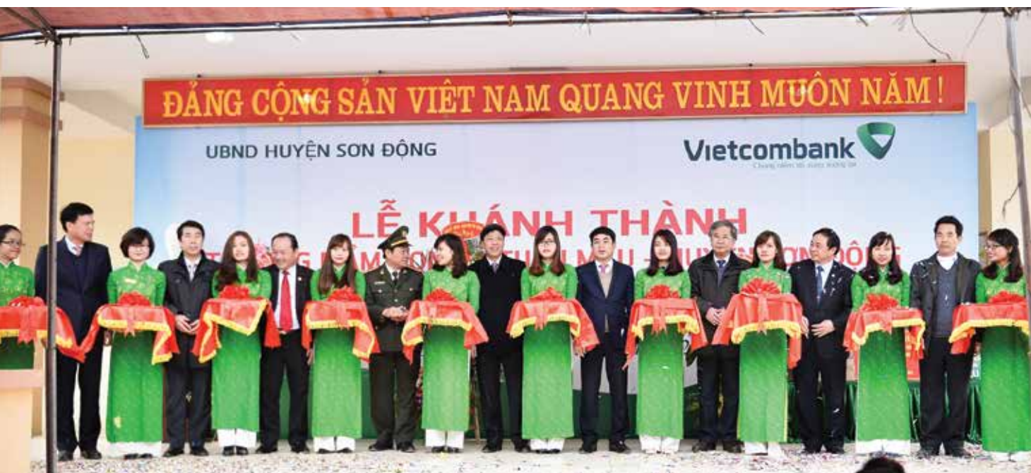
Các đại biểu tham dự Lễ cắt băng khánh thành Trường mầm non xã Tuấn Mậu, huyện Sơn Động, tỉnh Bắc Giang