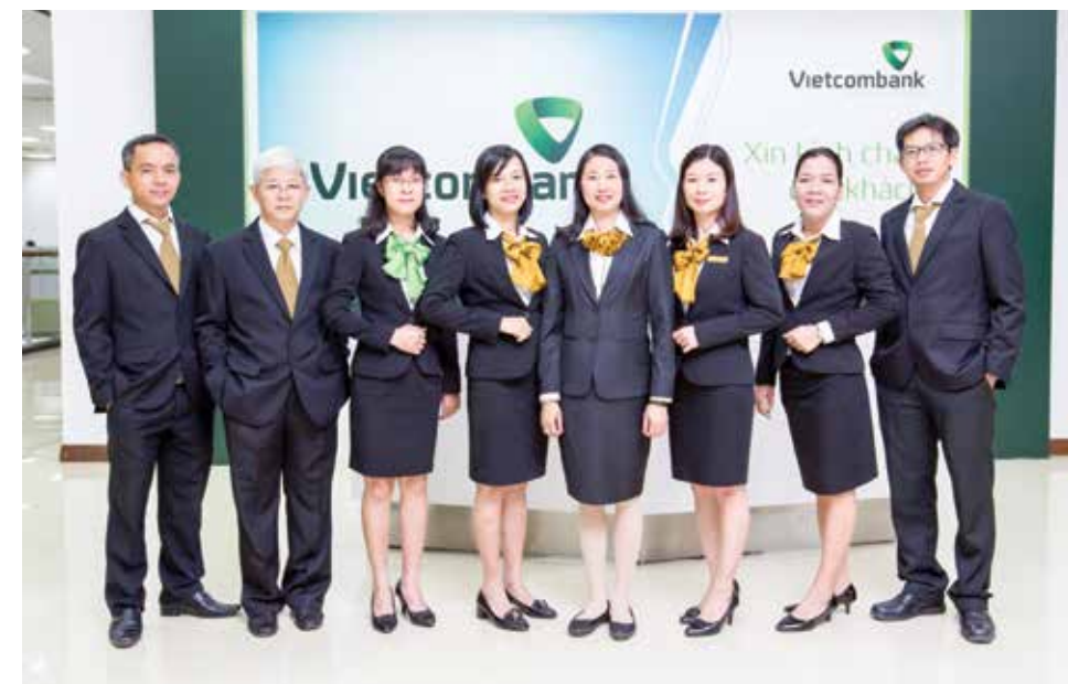
CBNV Vietcombank Đồng Nai