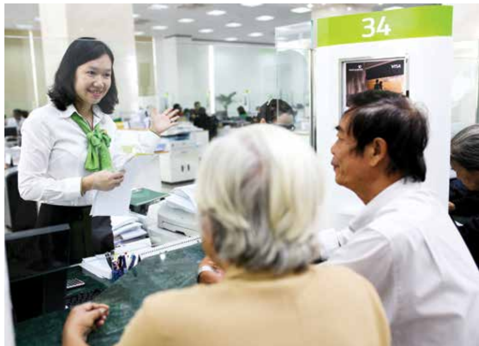
Khách hàng giao dịch tại Vietcombank Đồng Nai

Được thành lập từ ngày 1/4/1991, trải qua 25 năm hình thành và phát triển, Vietcombank Đồng Nai ngày càng khẳng định vị thế là một ngân hàng có uy tín trên địa bàn, được khách hàng tin yêu lựa chọn.