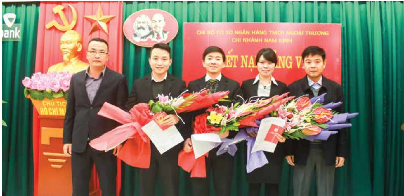
Chi ủy và Ban giám đốc Vietcombank Nam Định tặng hoa chúc mừng các đồng chí Đảng viên mới