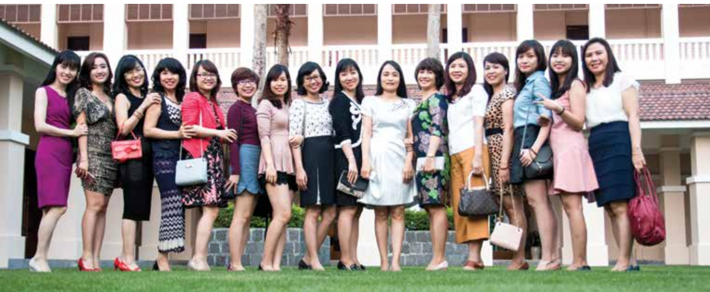
Chụp ảnh trước giờ khai tiệc