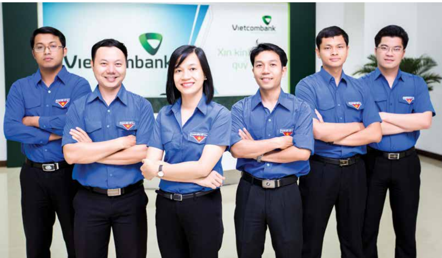
Đoàn TN Vietcombank Đồng Nai