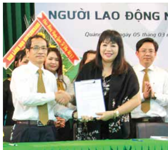
Ký kết giao ước thi đua năm 201

Từ đó, chiều ngày 4/3/2016, Vietcombank Quảng Ngãi đã tổ chức Hội nghị trú bị với các thành phần là các Trưởng/phó phòng đại diện cho 200 cán bộ nhân viên. Tại Hội nghị, các đại biểu đã nghe báo cáo về thực hiện Quy chế dân chủ cơ sở năm 2015 và một số nhiệm vụ trọng tâm năm 2016, báo cáo về tình hình sử dụng quỹ tiền lương và các quỹ có liên quan đến Người lao động, báo cáo hoạt động của Ban thanh tra nhân dân năm 2015 và phương hướng hoạt động năm 2016, báo cáo giám sát việc thực hiện hợp đồng lao động, thỏa ước lao động tập thể, các nội quy, quy chế... 100% các đại biểu đã thống nhất các nội dung trong các báo cáo: Việc thực hiện Quy chế dân chủ cơ sở được