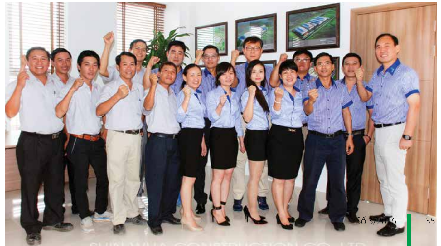
Tập thể Giám đốc và nhân viên Shinwa

tôi gặp trở ngại trong hoạt động của doanh nghiệp, các bạn thực sự quan tâm giúp chúng tôi giải quyết vấn đề. Chúng tôi tin rằng nếu tiếp tục phát huy những ưu thế trên thì Vietcombank sẽ ngày càng thu hút được nhiều khách hàng, ngày càng phát triển và là người bạn thân thiết của các doanh nghiệp. Và con đường kinh doanh của công ty TNHH Xây dựng Shinwa chúng tôi sẽ mãi “Chung niềm tin vững tương lai” cùng Vietcombank Đồng Nai các bạn. Nhân dịp kỷ niệm 25 năm thành lập và khánh thành trụ sở mới của Vietcombank Đồng Nai, Công ty TNHH Xây dựng Shinwa xin chúc mừng những kết quả mà Vietcombank Đồng Nai đã đạt được và tin tưởng rằng Vietcombank Đồng Nai sẽ ngày càng vươn xa hơn nữa và luôn đồng hành cùng Shinwa. □