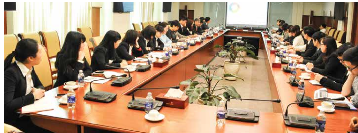
Toàn cảnh phiên họp 1/2016 Ủy ban Quản trị Dữ liệu Vietcombank.