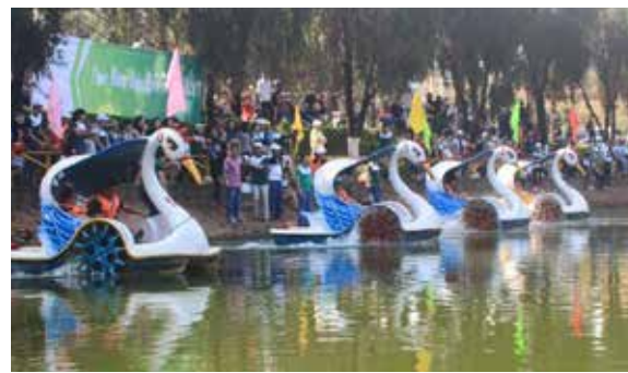
Các đội chuẩn bị thi tài

Đây là một trong những hoạt động vui chơi giải trí mang tính tập thể nhằm mục đích rèn luyện thể dục thể thao trên tinh thần đoàn kết chia sẻ và hỗ trợ lẫn nhau trong công việc, cuộc sống và qua đó, thắt chặt tình cảm, mối quan hệ của toàn thể cán bộ Vietcombank Gia Lai. □