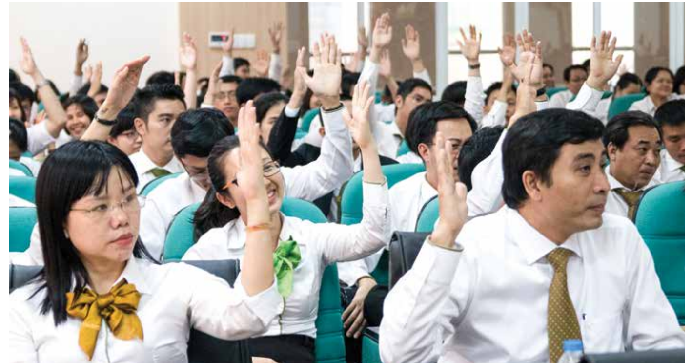
Biểu quyết thông qua Nghị quyết Hội nghị

Về hoạt động kinh doanh, phần đầu hoàn thành vượt mức toàn bộ các chỉ tiêu của Tổng giám đốc giao cho năm 2016, bao gồm: Huy động vốn vượt 8.303,2 tỷ đồng, số dư huy động vốn bình quân vượt 7.320,7 tỷ đồng; Dự nợ tín dụng vượt 8.593 tỷ đồng, bình quân vượt 7.366,6 tỷ đồng; số dư nợ xấu tối đa năm 2016 là dưới 32,5 tỷ đồng; Doanh số thanh toán xuất nhập khẩu đến 31/12/2016 vượt 793,6 triệu USD; Số dư bảo lãnh bình quân vượt 600 tỷ đồng; Doanh số mua bán ngoại tệ vượt 497 triệu USD; Hoàn thành tốt các chỉ tiêu về thẻ, ngân hàng điện tử và phát triển khách hàng mới; Lợi nhuận từ hoạt