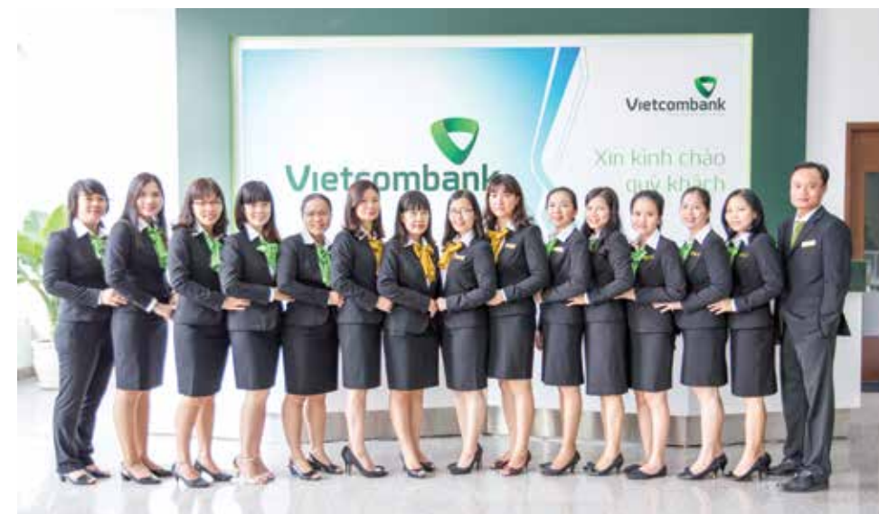
CBNV Vietcombank Đồng Nai

Có được "Thiên thời" và "Địa lợi", nhưng Vietcombank Đồng Nai non trẻ, với muôn vàn khó khăn của buổi đầu thành lập, cũng phải đối mặt với nhiều bất lợi và áp lực trong kinh doanh. Là một đơn vị nhỏ cả về quy mô vốn, tín dụng, hệ thống khách hàng, nhân lực, mạng lưới... Vietcombank Đồng Nai ngày đó đã phải rất vất vả "đương đầu" với sự cạnh tranh gay gắt của các ngân hàng thương mại (NHTM) có truyền thống khác, vốn đã hoạt động ổn định và xây dựng được mạng lưới khá rộng khắp trên địa bàn tỉnh Đồng Nai. Từ thực tiễn hoạt động, trên cơ sở đánh giá tương quan lực lượng với tinh thần "biết mình, biết người", Vietcombank Đồng Nai nhận thức được rằng có rất ít cơ hội thành công nếu cạnh tranh với các NHTM khác bằng lãi suất. Chính vì vậy, Vietcombank Đồng Nai đã tìm tòi, xác định rõ cho mình một hướng đi chiến lược trong cạnh tranh, đó là cạnh tranh bằng chất lượng dịch vụ và thương hiệu. Cùng với việc duy trì quan hệ tốt với các khách hàng đang có là những doanh nghiệp nhà nước, Vietcombank Đồng Nai đã tận dụng tốt lợi thế của thương hiệu Vietcombank để phát triển mở