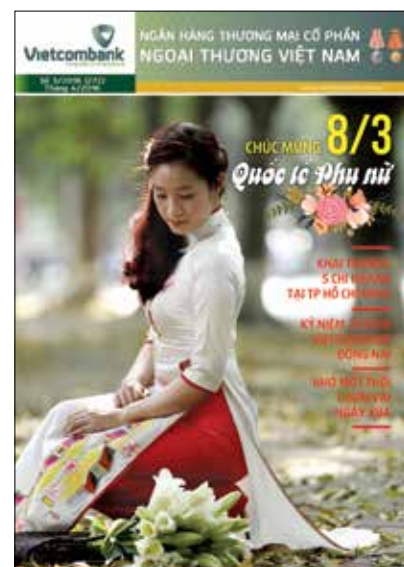
BẢN TIN CỦA NGÂN HÀNG TMCP NGOẠI THƯƠNG VIỆT NAM SỐ 3/2016 (272), Tháng 4/2016