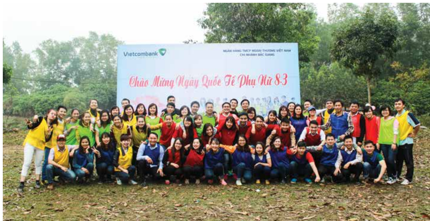
Vietcombank Bắc Giang tham dự chương trình chào mừng ngày Quốc tế phụ nữ 8/3