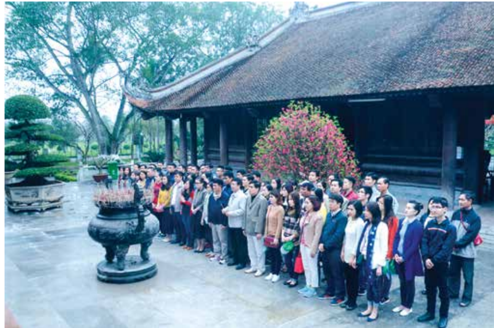
Vietcombank Quảng Ninh dâng hương tại Nhà tưởng niệm Hồ Chí Minh

(Trích "Theo chân Bác" – Tố Hữu) Bước chân vào khu di tích Kim Liên, chúng tôi lắng lại trong không gian tĩnh lặng và thanh bình của vùng quê