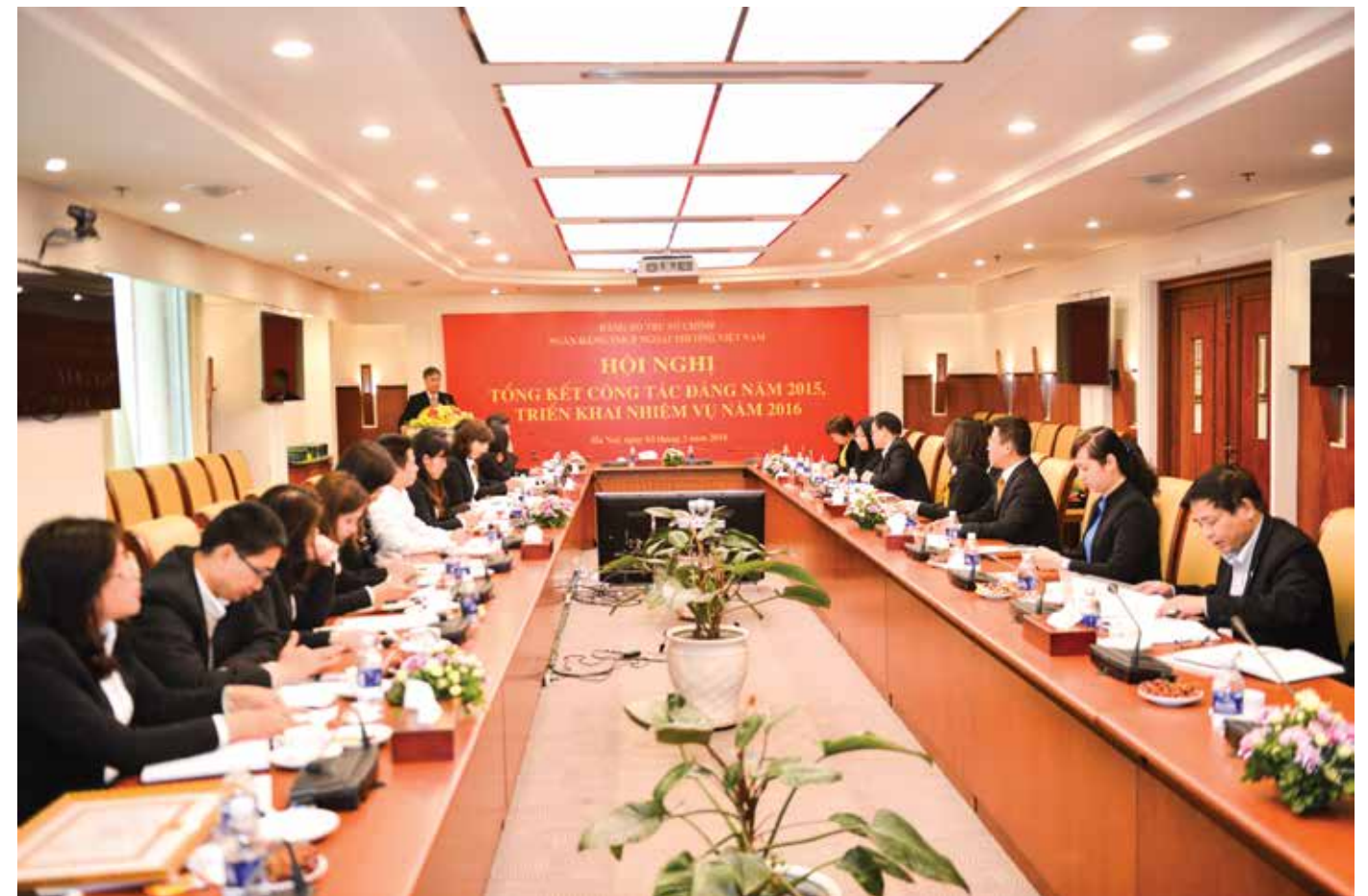
Toàn cảnh Hội nghị