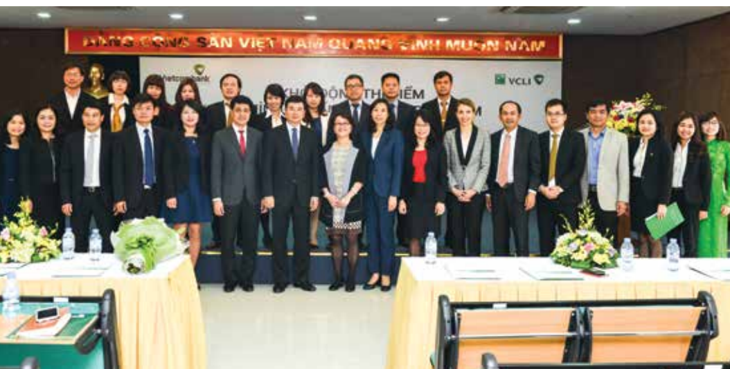
Các đại biểu tham dự sự kiện chụp hình lưu niệm tại Hà Nội