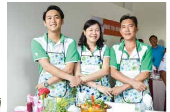
Đội nấu ăn Vietcombank Cà Mau