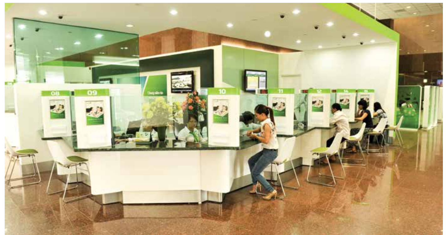
Giao dịch tại Vietcombank

Ngân hàng Thương mại cổ phần Ngoại thương Việt Nam (Vietcombank) là ngân hàng chuyên doanh đầu tiên của Việt Nam hoạt động trong lĩnh vực kinh tế đối ngoại. Trải qua hơn 50 năm xây dựng và phát triển, Vietcombank đã có những bước chuyển mình