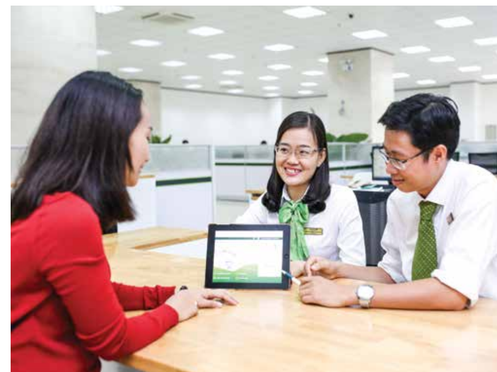
Đoàn viên TN Vietcombank Đồng Nai tư vấn với khách hàng