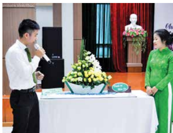
Tác phẩm giành giải Nhất của Tổ đoàn Khách hàng Doanh nghiệp – Khách hàng bán lẻ

Các đội thi thông qua hình thức biểu đạt từ ý nghĩa mỗi loài hoa, từ cách sắp xếp bố cục bài thi của mình đã mang đến cho hội thi những tác phẩm mang tính