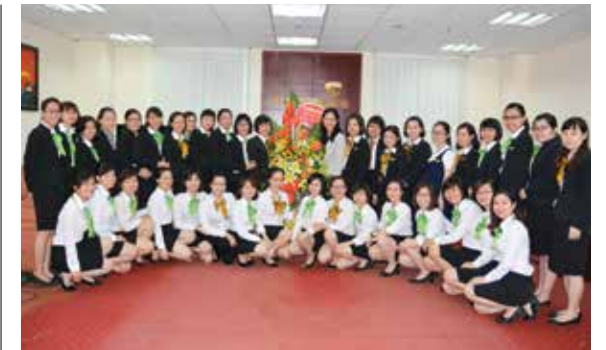
Tập thể cán bộ nữ Vietcombank Hải Dương

Chuyến đi thăm Bảo tàng Phụ nữ Việt Nam thật sự có ý nghĩa với toàn thể cán bộ, người lao động nữ, giúp cho mỗi chị em đều cảm thấy vinh dự và tự hào về truyền thống của người phụ nữ Việt Nam