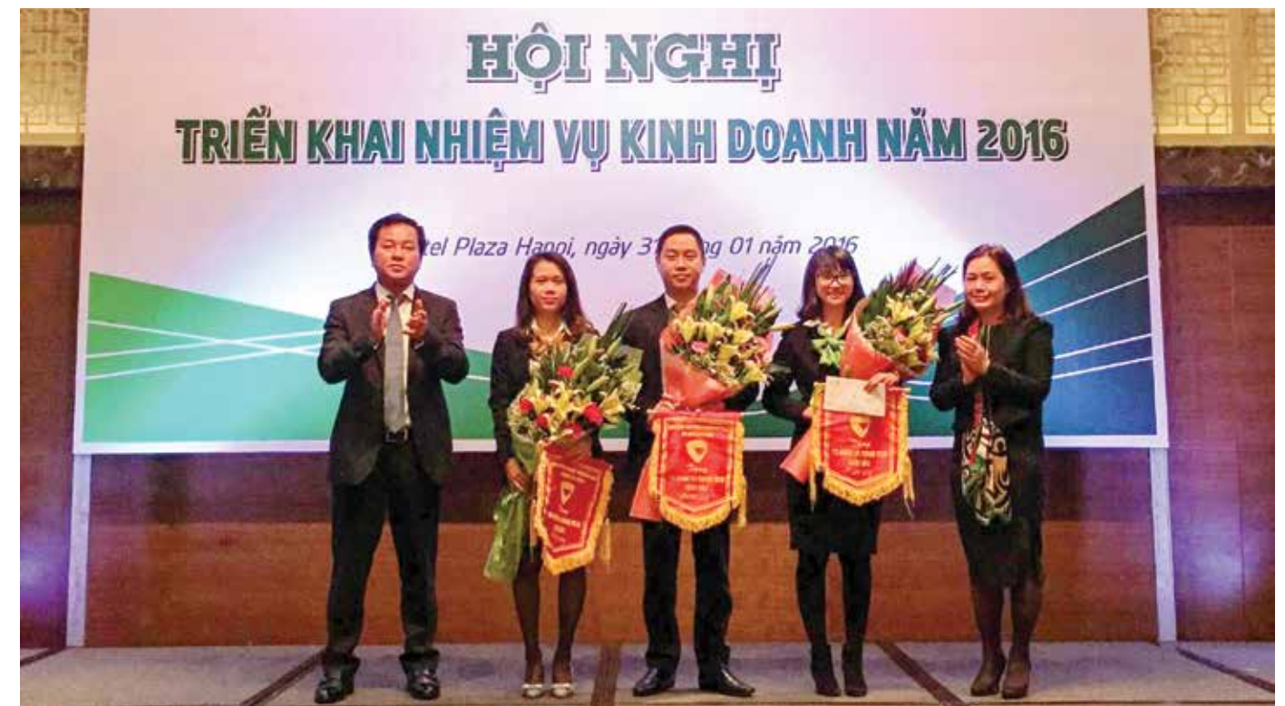
Ban giám đốc tặng danh hiệu thi đua và hoa cho các cá nhân xuất sắc năm 2015