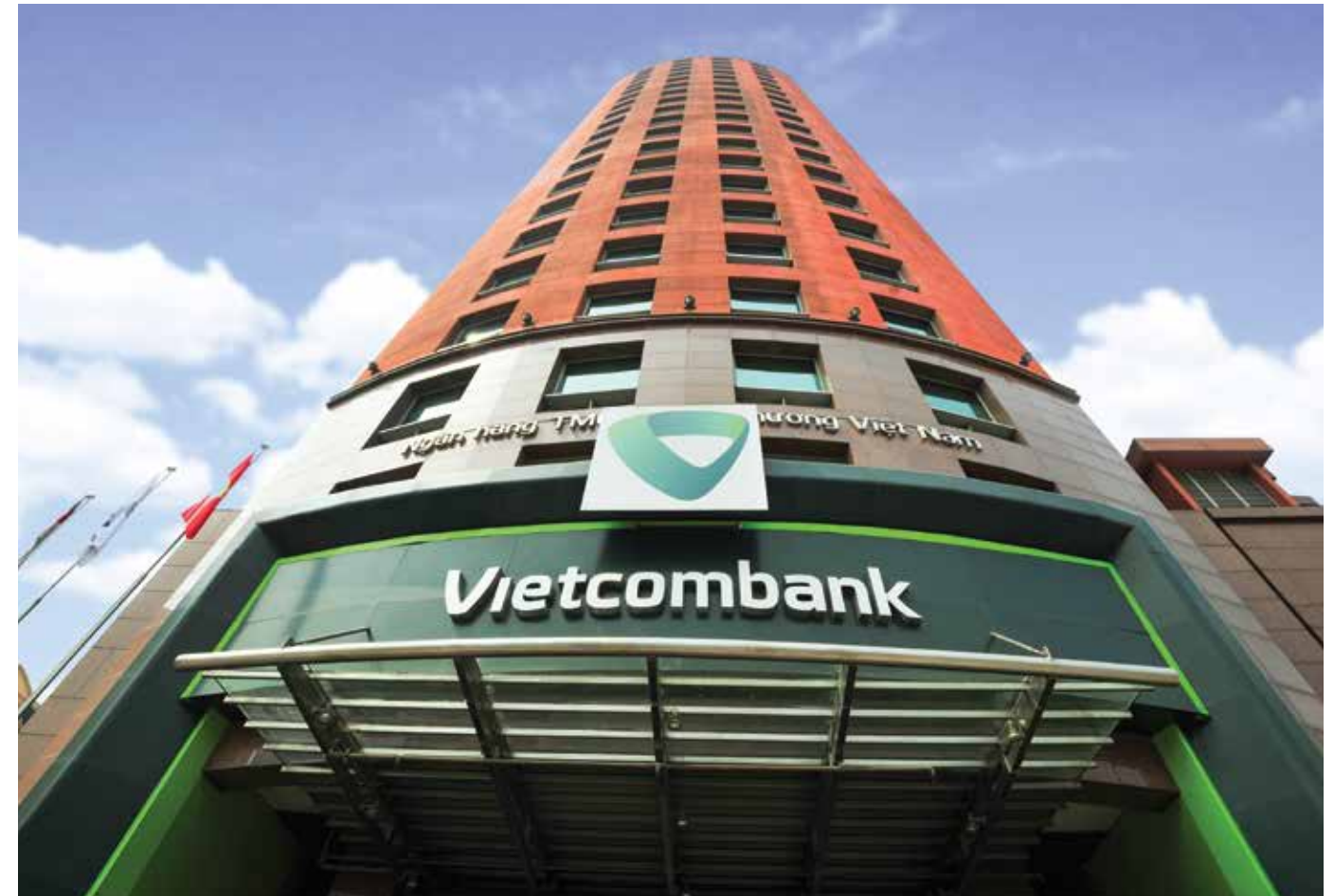
Tòa nhà Trụ sở chính Vietcombank