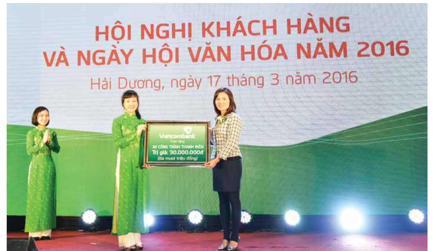
Đoàn thanh niên Vietcombank Hải Dương trao tặng 30 công trình thanh niên trị giá 30 triệu đồng