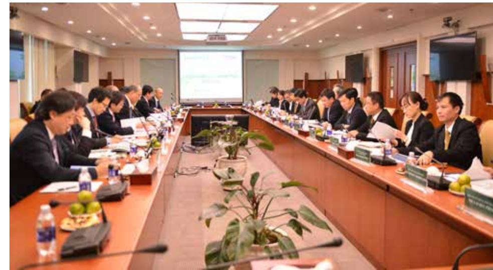
Toàn cảnh Phiên họp