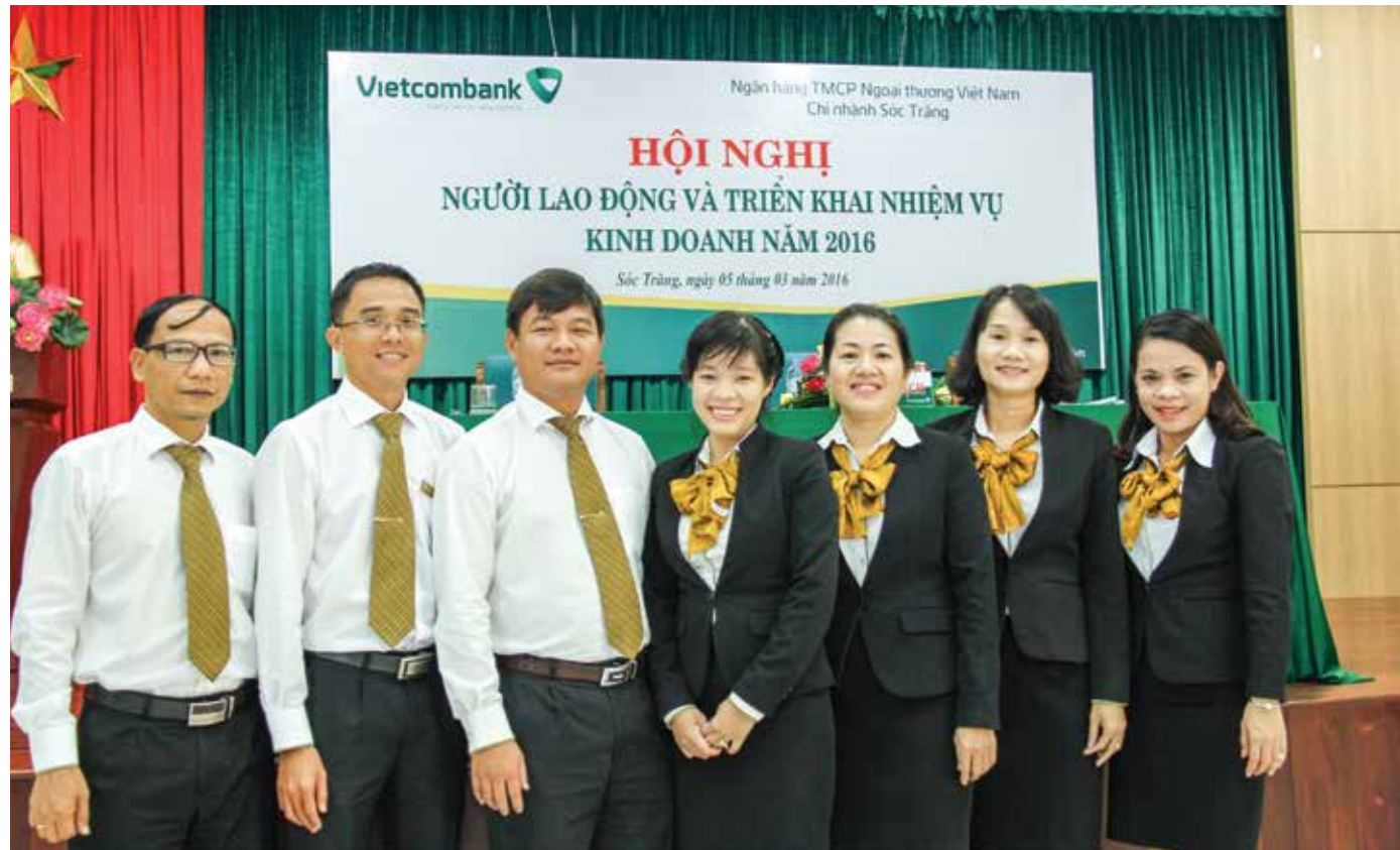
Các đại biểu chụp ảnh lưu niệm