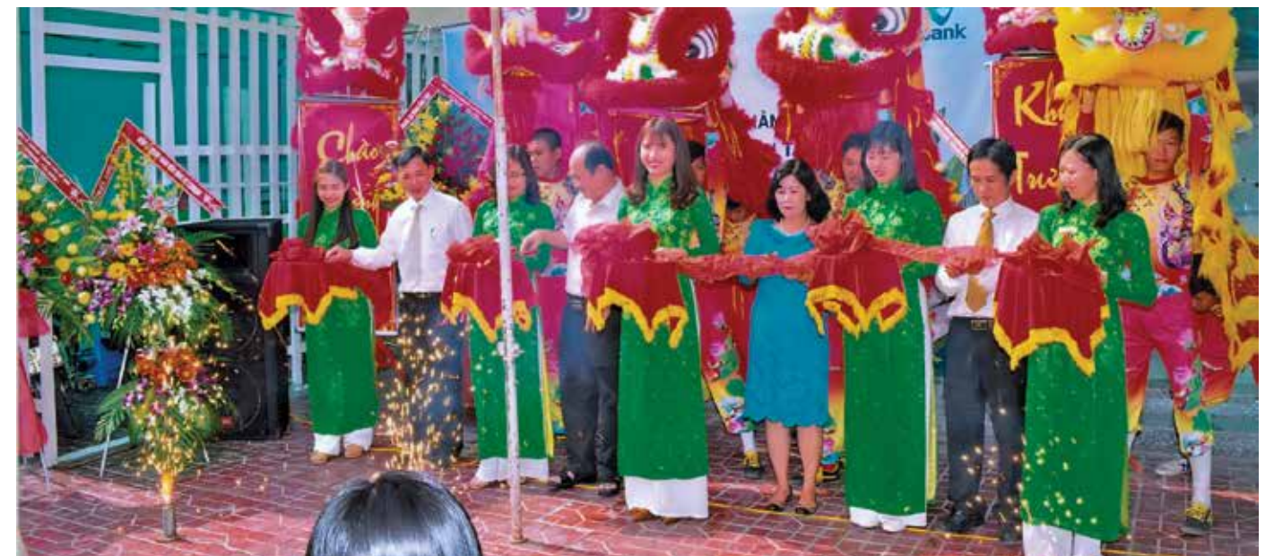
Các đại biểu cắt băng khánh thành Trụ sở mới PGD Tân Châu.

mua trụ sở hoạt động đối với PGD Tân Châu. Dự án cải tạo sửa chữa trụ sở PGD Tân Châu được bắt đầu và hoàn thành vào tháng 12/2015. Ngày 24/2/2016, được sự cho phép của Ngân hàng Nhà nước tỉnh An Giang, Lễ khánh thành Trụ sở mới PGD Tân Châu long trọng được tổ chức tại địa chỉ mới số 127 đường Tôn Đức Thắng, phường Long Thạnh, thị xã Tân Châu, tỉnh An Giang với sự tham dự của đại diện các cơ quan, ban ngành trên địa bàn cùng quý khách mời là các tổ chức, cá nhân đã từng gắn bó, giao dịch tại PGD trong thời gian qua. Với diện mạo mới, PGD Tân Châu sẽ có điều kiện hoạt động tốt hơn và ngày càng mang lại hiệu quả nhiều hơn cho Vietcombank Châu Đốc và cho hệ thống Vietcombank. □