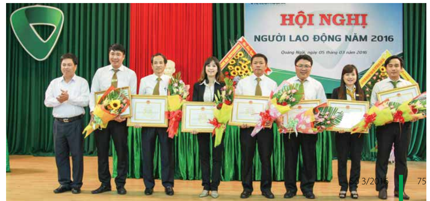
Trao tặng Giấy khen cho các tập thể và cá nhân có thành tích xuất sắc trong phong trào thi đua năm 2015.

Sau nửa ngày làm việc tích cực, nghiêm túc với tinh thần trách nhiệm cao, Hội nghị Người lao động năm 2016 Vietcombank Quảng Ngãi đã bế mạc với kết quả thành công tốt đẹp. □