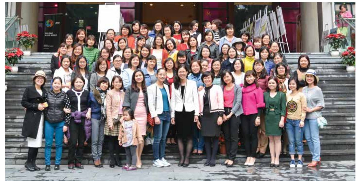
Tập thể cán bộ nữ Vietcombank Hải Dương tại Bảo tàng phụ nữ Việt Nam

để tiếp tục phát huy những nét đẹp, đóng góp xứng đáng vào sự nghiệp xây dựng và bảo vệ đất nước, đồng thời luôn là chỗ dựa tin cậy cho mỗi mái ấm gia đình, xây dựng cuộc sống ngày càng giàu đẹp đúng như Bác Hồ đã nói: “Non sông gấm vóc Việt Nam do phụ nữ ta, trẻ cũng như già, ra sức dệt thêu mà thêm tốt đẹp, rực rỡ”. □